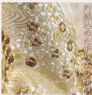
丹波込めた手織りの逸品