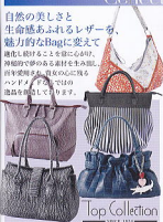
Top Collection SINCE 1988

進化し続けることを心にこめ、 神秘的で夢のある素材を生み出し、 四季愛用され、貴女の心に残る ハンドメイドならではの 逸品を創造してまいります。