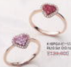
K18PGルビーリング R10.5ct D0.10ct ¥139,000