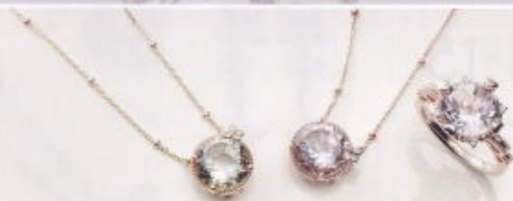
K18WGルビーネックレス D0.30ct ¥169,000 ¥72,000