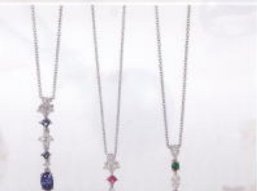
K18WGサファイア ネックレス SP0.77ct D0.20ct ¥329,000 ¥152,000