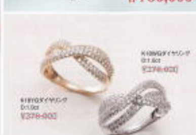
K18WGダイヤリング D1.0ct ¥279,000