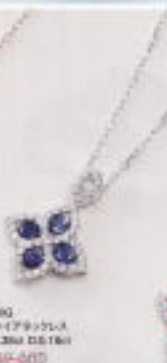
K18WG サファイアリング S0.03ct D0.10ct ¥399,000