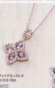
K18WG ピンクサファイアリング P0.03ct D0.10ct ¥399,000