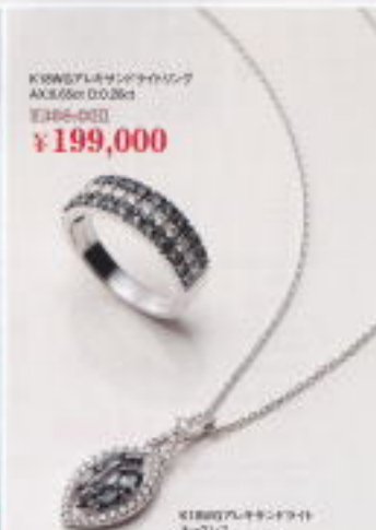
K18WGルビーネックレス AK0.50ct D0.20ct ¥389,000 ¥199,000