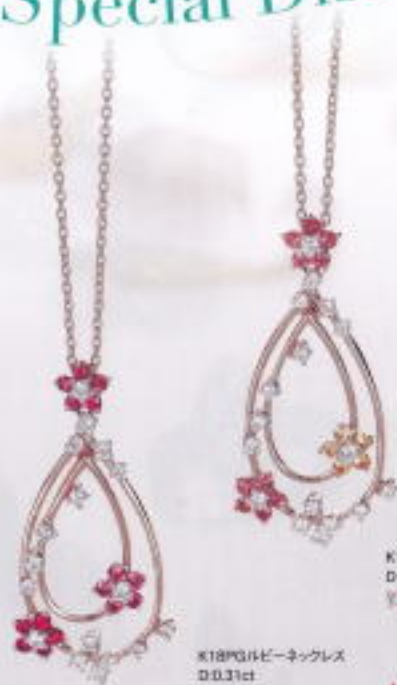
K18PGルビーネックレス D0.31ct ¥259,000