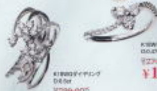
K18WGダイヤリング D0.48ct ¥279,000 ¥119,000