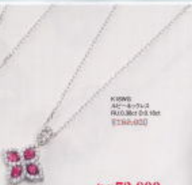
K18WG AC-ルビー リング R0.03ct D0.10ct ¥399,000