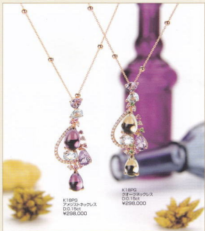
K18PG ファシストネックレス D:0.15ct ¥298,000