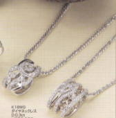
K18WG ダイヤモンド 0.03ct ¥350,000