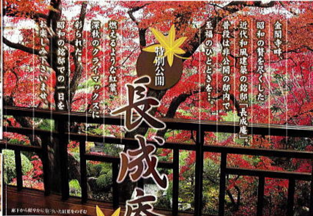
床下から紅葉が覗きつゝ、天井をのぞく