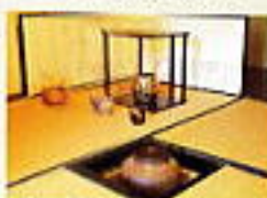
心晴らし茶室をたしなむ