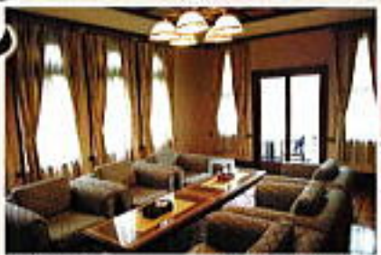
和作のアルファ、 最も古い丸窓囲みの北投間