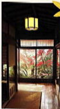
衣類が掛かっている廊下