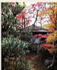
八雲形の珍しい茶室