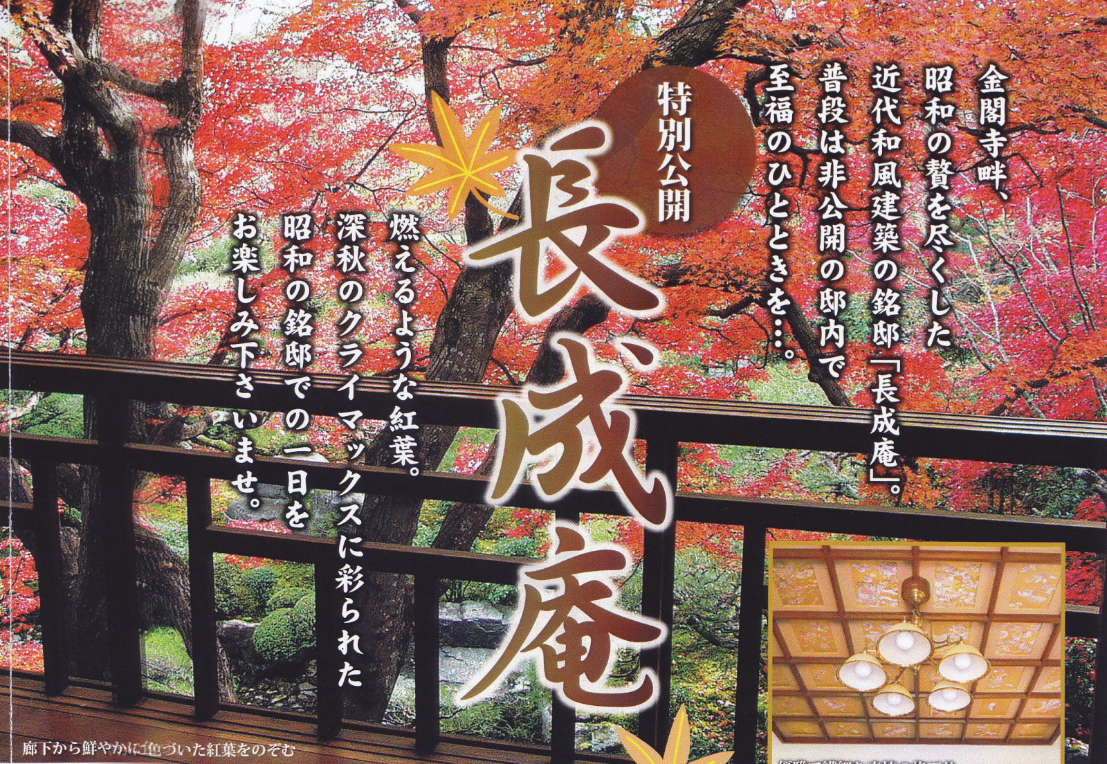
廊下から鮮やかに色づいた紅葉をのぞむ

燃えるような紅葉。 深秋のクライマックスに彩られた 昭和の銘邸での一日を お楽しみ下さいませ。