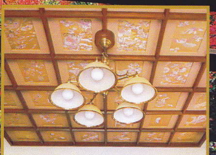
優雅で繊細な表情の格天井