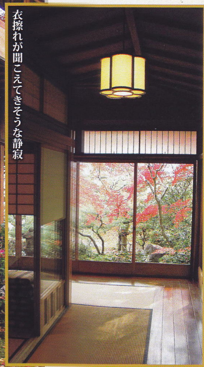
衣擦れが聞こえてきそうな静寂