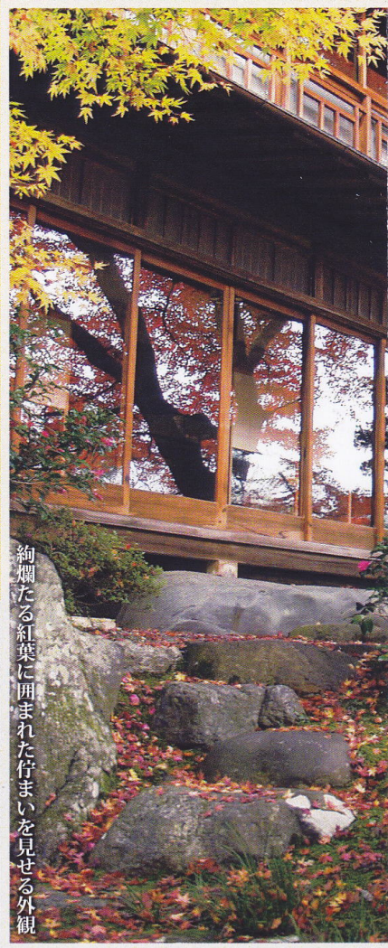
絢爛たる紅葉に囲まれた佇まいを見せる外観