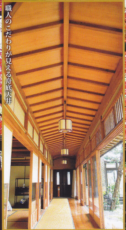
職人のこだわりが見える舟底天井