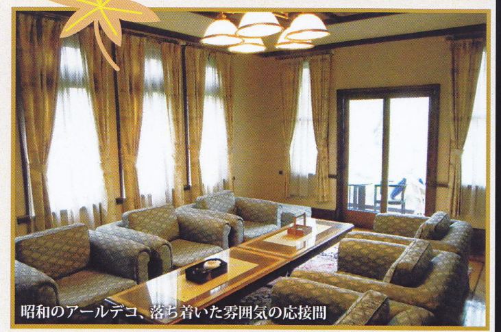
昭和のオールデコ、落ち着いた雰囲気の出接間