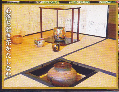
心落ち着き茶をたしなむ